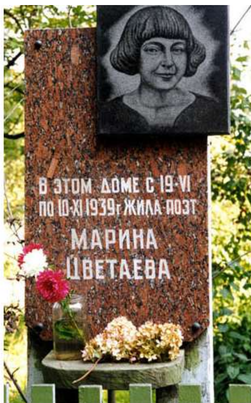
Мемориальный дом-музей М.И. Цветаевой в Болшево г. Королев - единственный в Московской области музей великого русского поэта

50. Цветаева, М. Надеюсь - сговоримся легко: письма 1933-1937 годов / М. Цветаева, В. Руднев; авт. предисл. В. К. Лосская; издание подготовлено Л. А. Мнухиным. - М.: Вагриус, 2005. - 204 с.