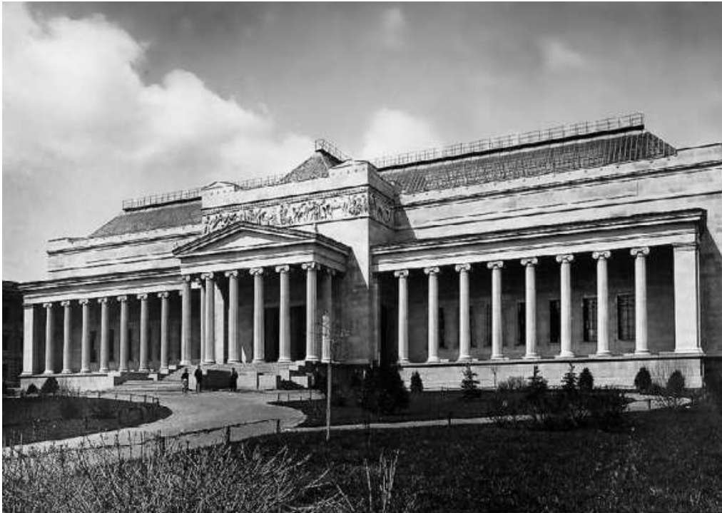
Музей изобразительных искусств им. Пушкина